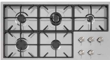
燃气灶 Foster Milano